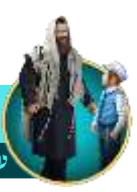
עובדות והלכות על המצווה החשובה