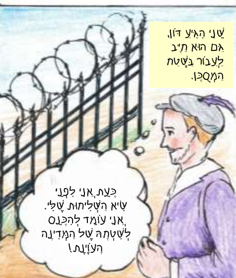
המערך 'בוא א"ה'